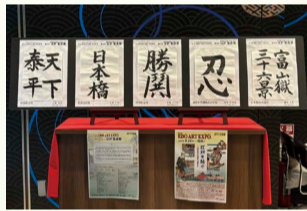
中央区観光情報センター