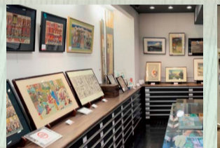
山田書店ギャラリー