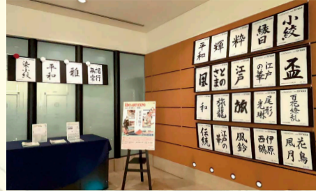
東武ホテルレバント東京