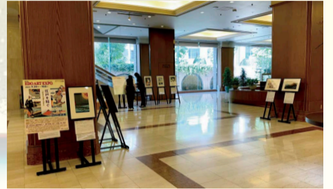
ロイヤルパークホテル