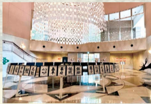
ピアウエストスクエア