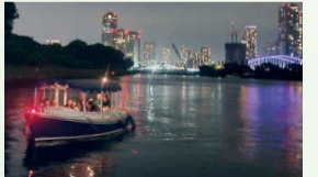
今年は初めて夜便を運航しました。

共催：(株)建設技術研究所 河川構造物や橋梁など水辺から見えるインフラについて、土木技術者がわかりやすくご案内する、4コース計14便の特別クルーズを開催しました。