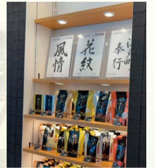
にんべん 日本橋本店