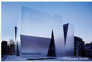
すみだ北斎美術館