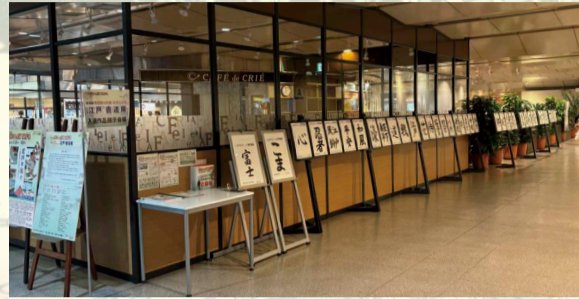
東京シティエアターミナル