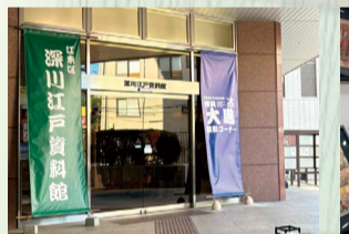
江東区深川江戸資料館