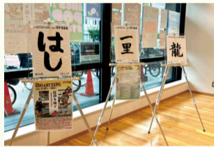
港区観光インフォメーションセンター