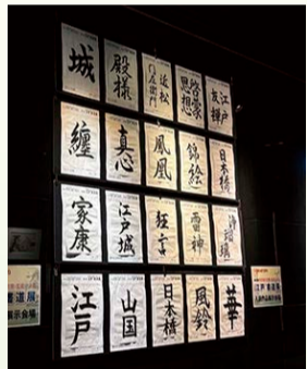
YUITO日本橋室町野村ビル