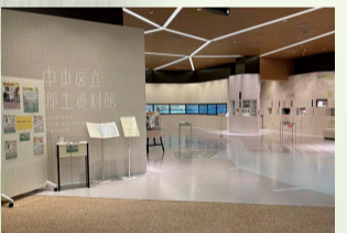
中央区立郷土資料館