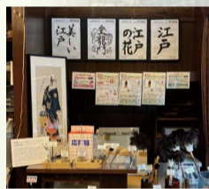
江戸屋/江戸屋所蔵刷毛ブラシ展示館